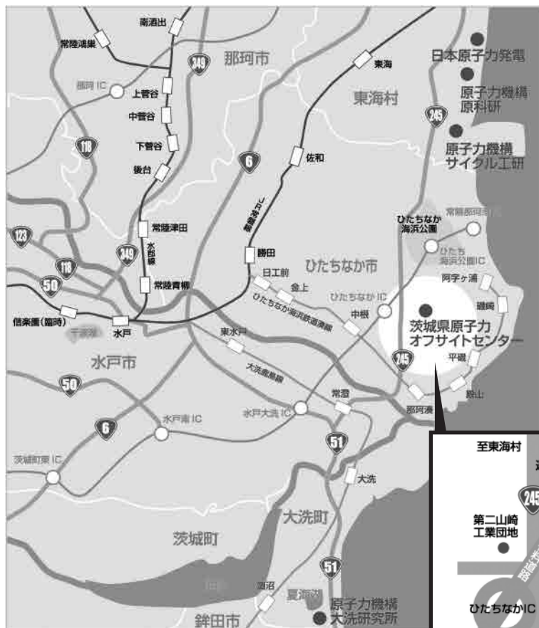
茨城県原子力オフサイトセンターパンフレットより